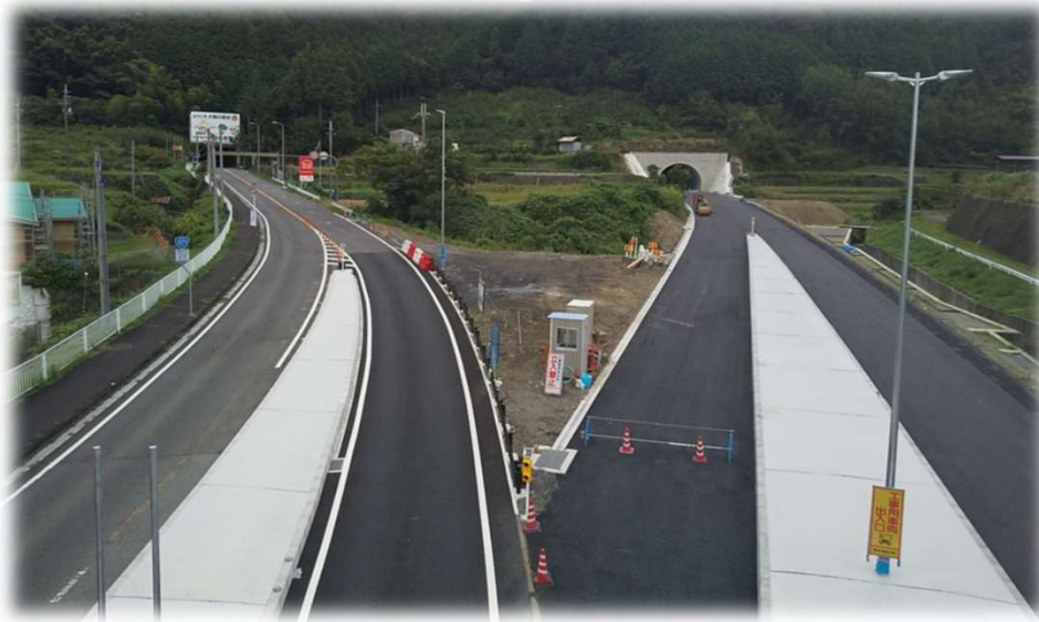
国道371号道路改良工事