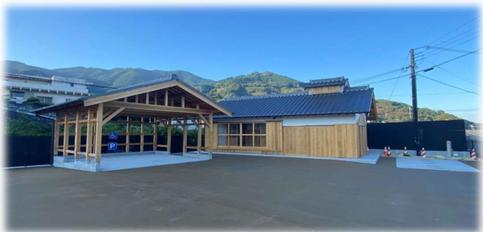
まちなみの駅(かつらぎ)建築工事