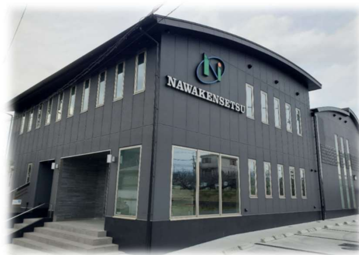
奈和建设(株) 事務所増築工事