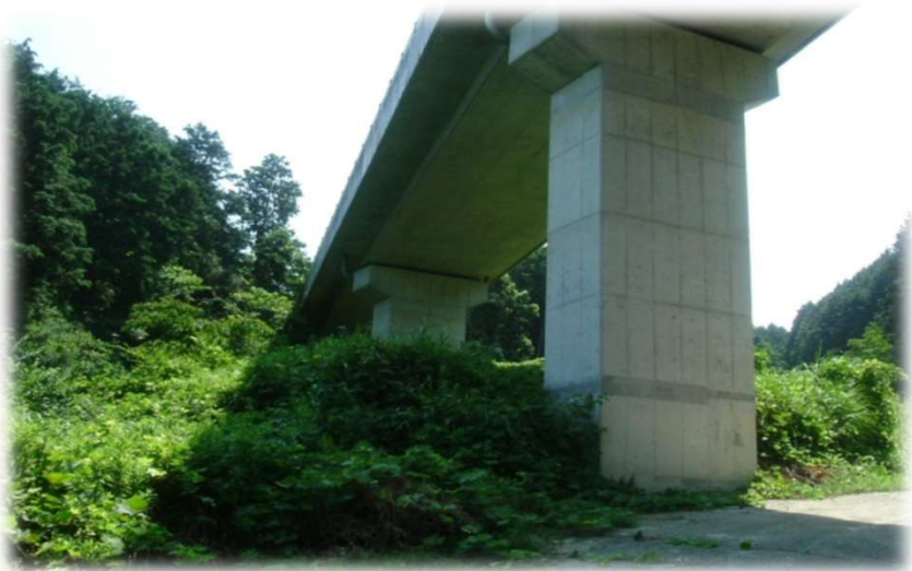
紀の川左岸地区 橋本5号橋下部工事