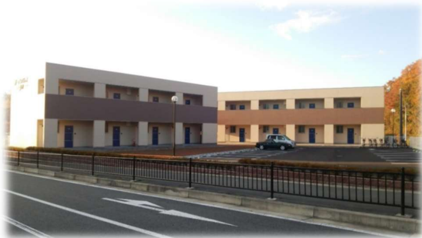
ガーデンパレスJIN新築工事