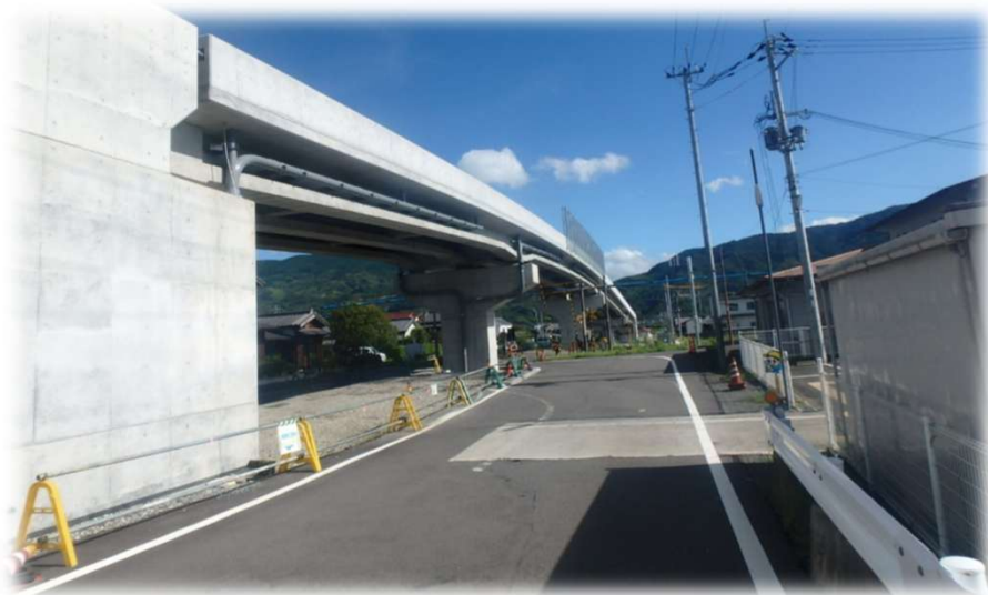
那賀かつらぎ線 道路改良工事