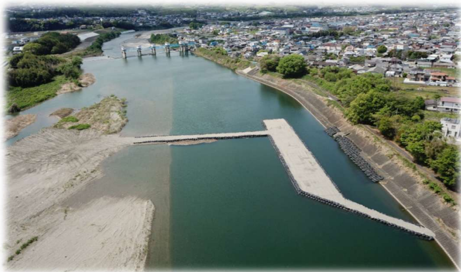
紀の川小田地区護岸補修工事