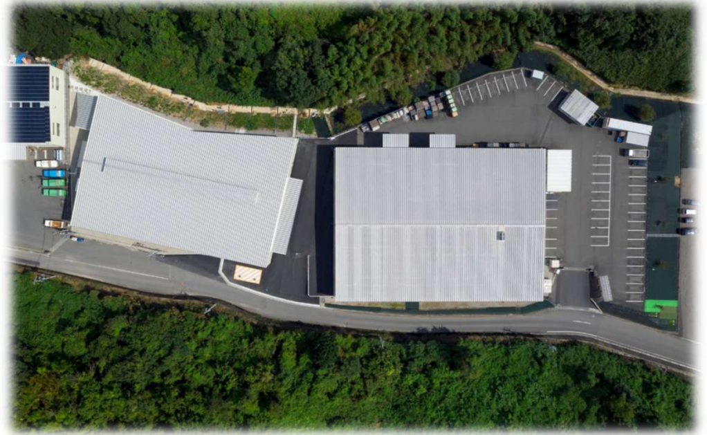
縁 橋本店新装工事