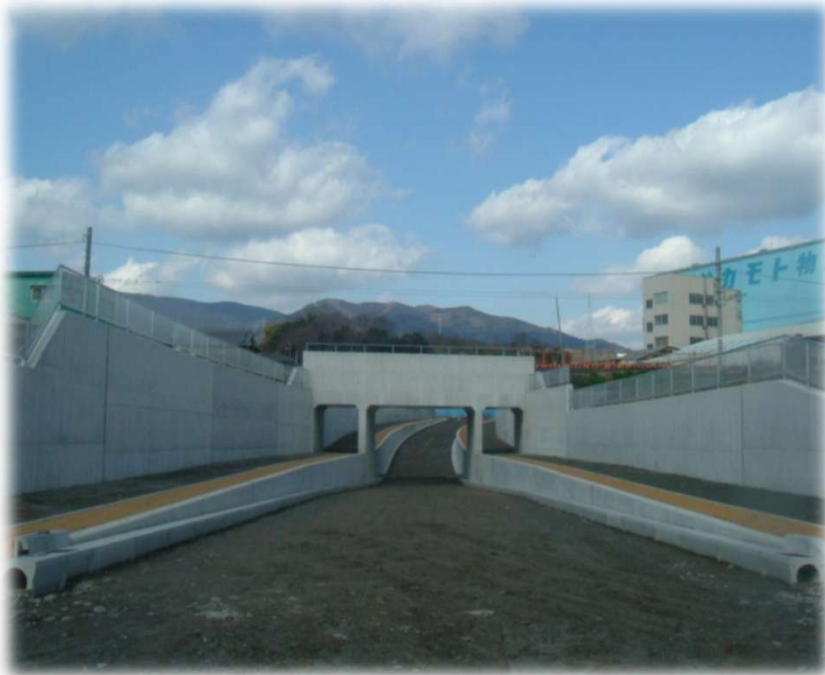
山田岸上線道路改良工事