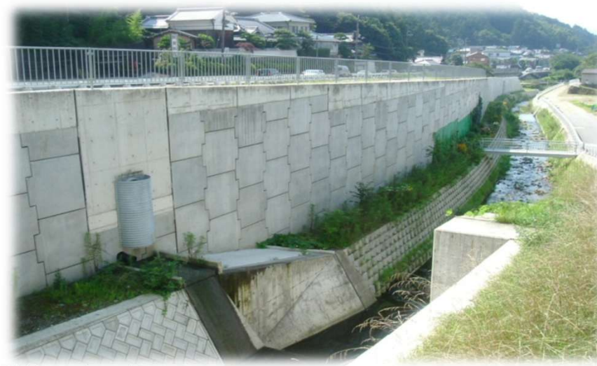
市道清水西畑線橋梁下部工事