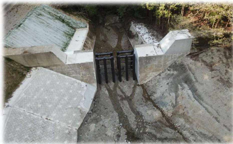
米の郷谷川砂防(砂防)工事