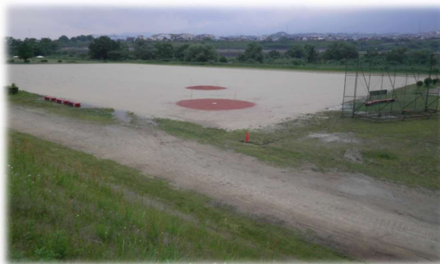
南馬場緑地広場グラウンド整備工事