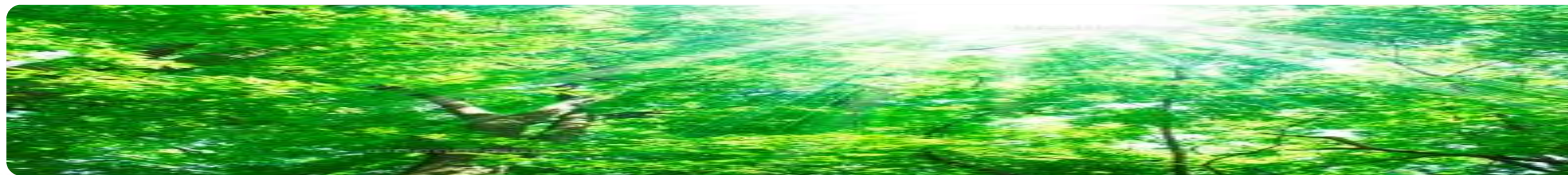
国保橋本市民病院外溝土木工事