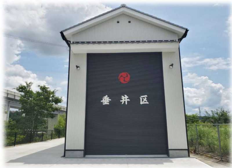
垂井区だんじり小屋新築工事